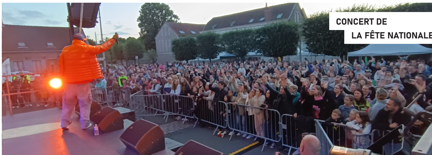
CONCERT DE LA FÊTE NATIONALE